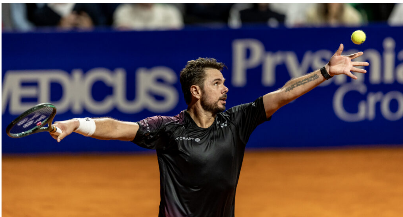
Wawrinka eliminado por el chileno Jarry – IEB+ Argentina Open 2024 Stan WAWRINKA

Wawrinka, de 38 años y ubicado en el puesto 60 del ranking mundial de la ATP, perdió con Jarry (21) luego de una batalla que duró dos horas y 53 minutos en el cruce que cerró la jornada del miércoles en el Buenos Aires Lawn Tennis Club.