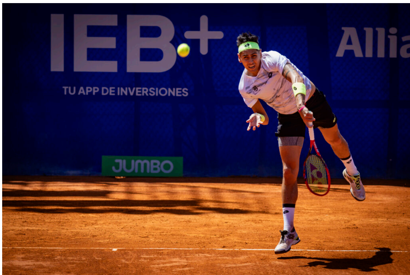
IEB+ Argentina Open 2024

El próximo rival del chileno de 26 años será el ganador del cruce que animarán más tarde el francés Arthur Fils (36), de 19 años y una de las atracciones del torneo, y el experimentado serbio Dusan Lajovic (58), de 33 años.