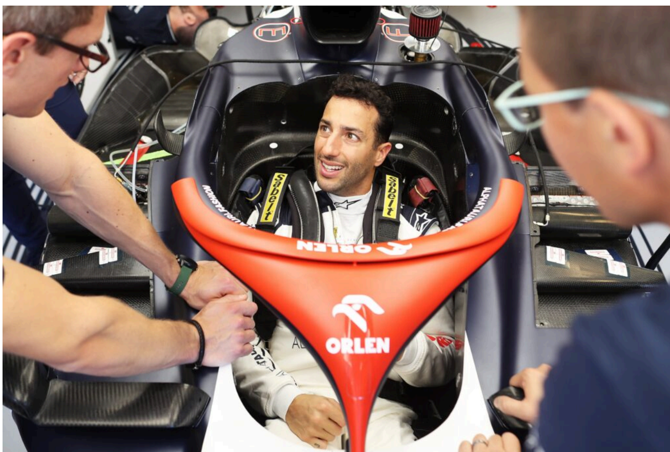
Turno de ensayos de la Fórmula 1 en el Hungaroring de Budapest – Daniel Ricciardo

Mientras que la qualy 1, en la que estarán únicamente los diez más veloces, será llevada a cabo exclusivamente con neumáticos blandos para los 12 minutos previstos.