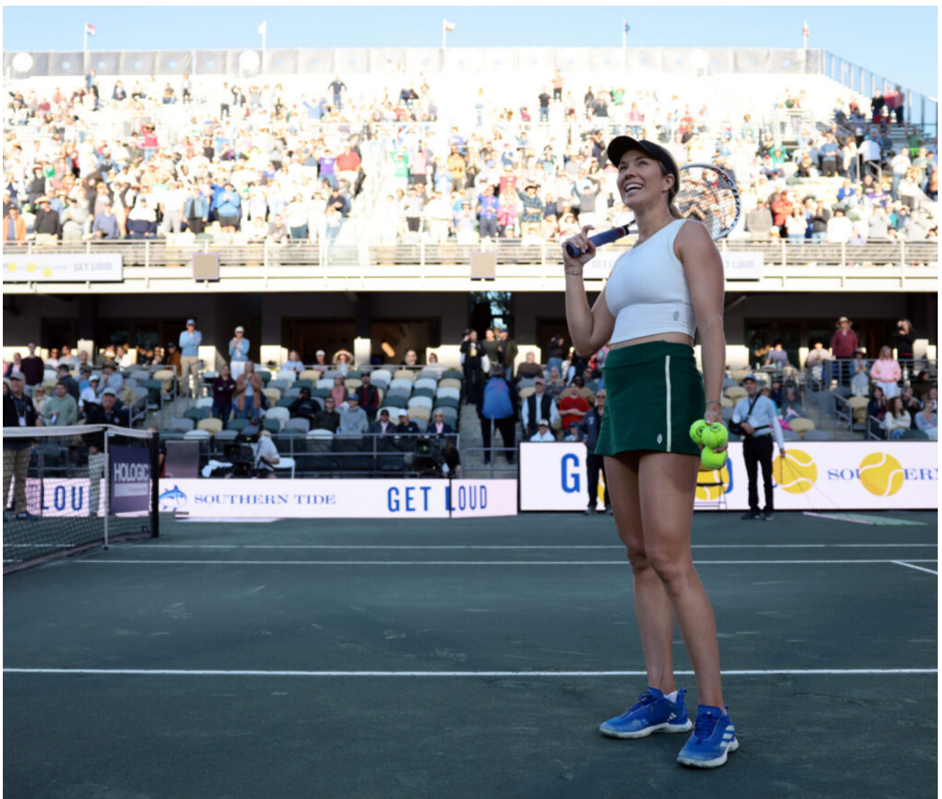
Previa de las semifinales del Credit One Charleston Open

La primera cabeza de serie Jessica Pegula se enfrenta a tercera Maria Sakkari , la número 4 Daria Kasatkina , ganadora en el 2017 de este torneo va por Danielle Collins , campeona del Abierto de Miami y posiblemente la mejor de la gira en este momento, con una racha de victorias de 11 partidos seguidos.