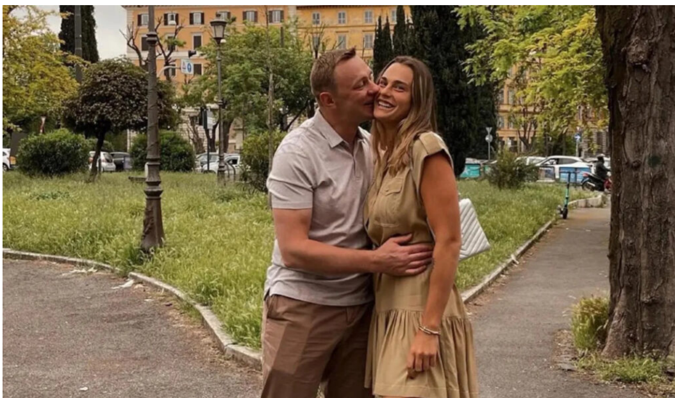
Aryna Sabalenka y su esposo, Konstantin Koltsov.

De forma inmediata, las autoridades comenzaron a buscar el motivo detrás de la muerte del reconocido jugador. Si bien en un primer momento se indicó que Koltsov había muerto “repentinamente”, el caso luego dio un repentino giro y pasó a ser considerado como un “probable suicidio”.